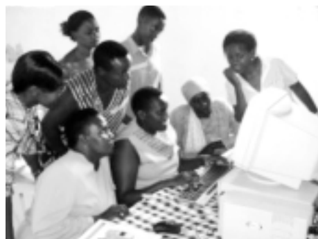
Mujeres rurales de la sede de UWEAL en Luwero asisten a una de las clases de computación.