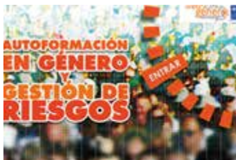
Imagen portada del curso

La ventaja del curso es que se adapta a las necesidades de formación pudiendo incorporar la presencia de una tutora, ejercicios y módulos extra, foros virtuales, y todo lo necesario para que el proceso sea lo más completo posible.