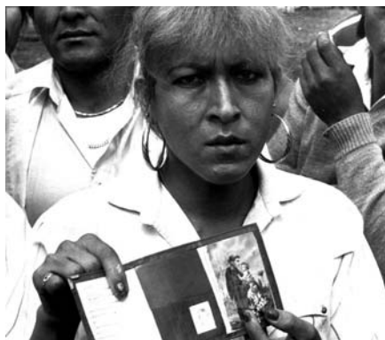
Una travesti muestra su carné de identidad, protestando porque ella sólo puede obtener uno si se registra como hombre.

Las y los travestis de la actualidad han heredado lo peor de ambos roles de género. En los espacios públicos se percibe que son lo suficientemente hombres como para ser golpeados por agentes de la policía, mientras que dentro de las relaciones todo depende. A veces se les percibe como masculinos, cuando trabajan para mantener a sus familias; en otros casos se les ve femeninos cuando enfrentan violencia, en ocasiones proveniente de su mismo círculo familiar. En el mercado laboral, la discriminación implica que el trabajo sexual sea casi la única opción disponible. Sin embargo, ahora las y los travestis se están movilizando para exigir sus derechos y ampliar sus posibilidades.