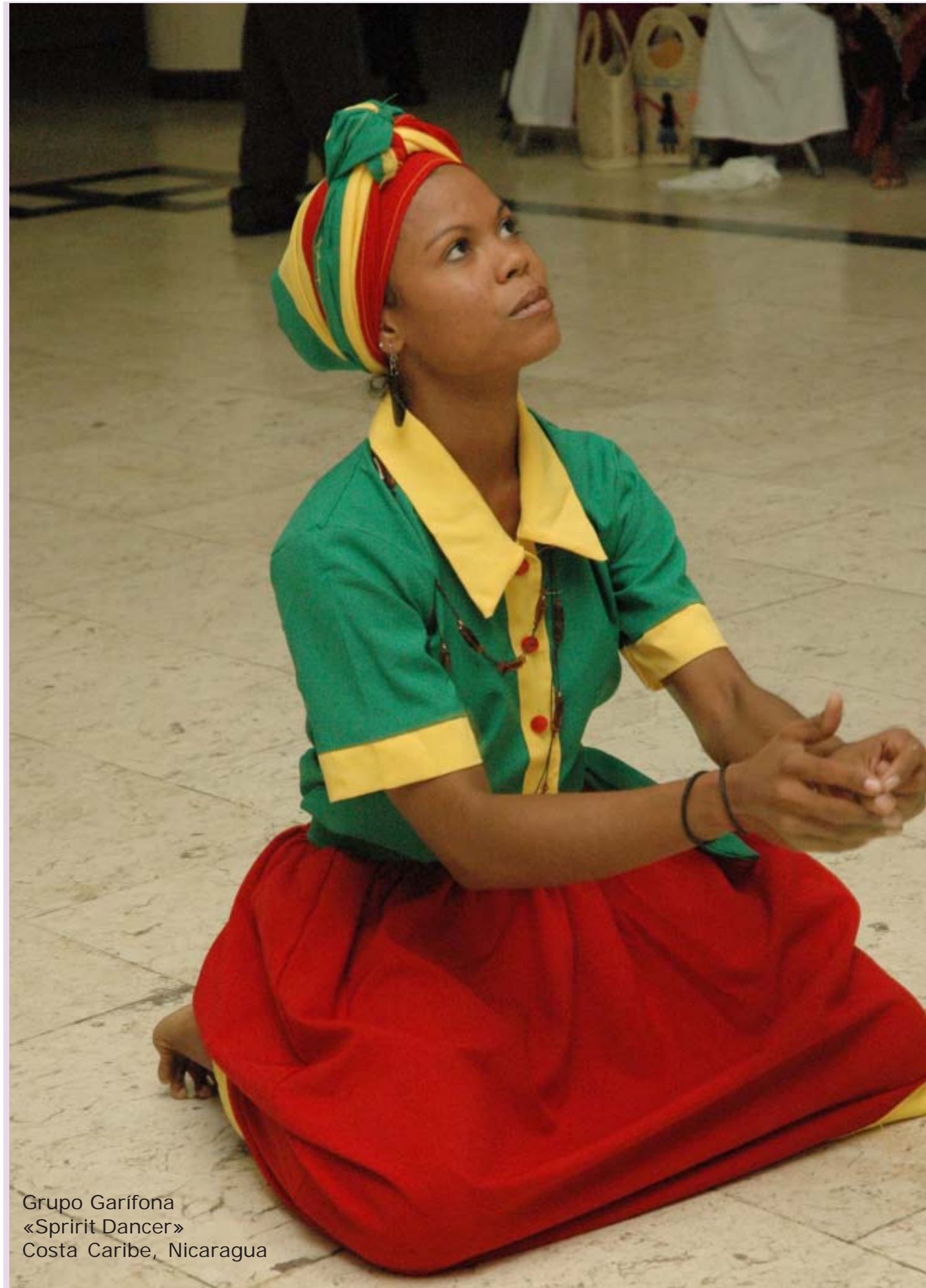
Grupo Garifona «Spirit Dancer» Costa Caribe, Nicaragua