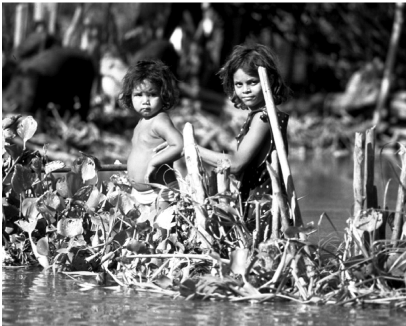
El empobrecimiento y la inseguridad económica de las mujeres socavan la resistencia a los desastres al igual que los altos índices de desnutrición y de enfermedades crónicas, los bajos índices de escolarización y alfabetización, la falta de información y de formación profesional, el transporte inadecuado y las limitaciones culturales sobre la movilidad. El cuidado de los demás produce muchas muertes de mujeres cuando deben adaptarse decisiones repentinas sobre la propia conservación o el rescate de los hijos y de los demás.

Las políticas, los datos y los análisis que tienen en cuenta los papeles y las necesidades tanto de las mujeres como de los hombres deberían seguir alimentando y financiando estos ejemplos que ayudan a dar forma al futuro programa de acción para la reducción de desastres.