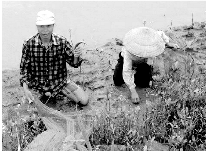
La plantación de mangle a cargo de voluntarios ahorra muertes y dinero en Vietnam. Desde 1994, la Cruz Roja de Vietnam ha plantado y protegido los manglares en el norte del país para proteger a la población costera de los tifones y de las tormentas.

Sin embargo, las mujeres no sólo son víctimas, también son agentes de cambio. Además, las mujeres y los hombres, trabajando juntos, pueden identificar los peligros que amenazan sus hogares y su sustento y trabajar juntos para construir comunidades más seguras. Algunos ejemplos ilustran cómo se puede hacer esto.