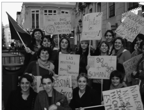
Manifestación 8 de marzo 2006.

Una tarde lluviosa, en las oficinas de una ONGD de Madrid, se encuentran tres periodistas en una reunión. Una trabaja en una revista política, otra en una agencia de noticias ecologista, la tercera en esa ONGD. Allí se reúne un grupo de mujeres que imagina formas de mejorar la vida de las mujeres de todo el mundo, que siente que la suya propia está unida a la de las demás. Entre todas piensan maneras de hacer visible la falta de derechos, la injusticia, la violencia sobre una mitad de la población del planeta, que ha nacido con sexo femenino. A la salida las tres perio-