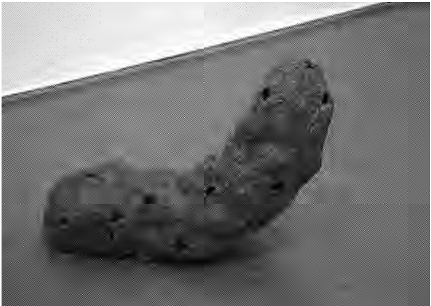
FIGURA 1: Jesús Martínez Oliva, Cuerpo penetrable (1998)

El cuerpo de hombre y su sexualidad, entendidos desde una perspectiva homosexual, constituyen así el núcleo de su trabajo: cuerpos rebeldes, indisciplinados, liberados, desafiantes, que se exponen y se dejan mirar en sus partes más íntimas. Especialmente el ano y el pene, partes anatómicas cargadas de una rica simbología, son recurrentes en sus dibujos y esculturas. El ano se convierte en un poderoso elemento del desafío de la norma establecida y se hace emblema del deseo y del placer que provoca precisamente la ruptura de los límites de una sexualidad monolítica y asfixiante, invirtiendo el significado de la pasividad sexual. Así en “Año solar” (dibujo sobre cartulina, de 1994) los años parecen estrellas de un fragmento del firmamento; en la escultura “Cuerpo penetrable” (1997) se ve un falo (“cuerpo”) de alambre e hilo de cobre constelado por varios agujeros, penetrables (figura 1); finalmente, en la serie “Miedos y fobias” (1995-1998) Martínez Oliva propone primeros planos de un ano abierto, a veces sangrante, a veces rodeado de una tela araña, otras veces semejante a la flor de la cala.