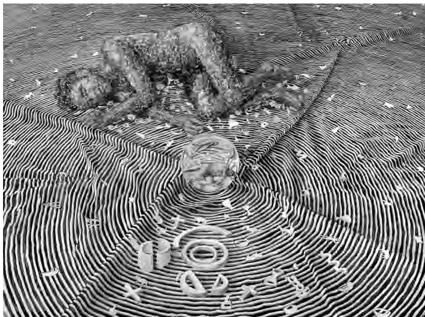
FIGURA 6: Antonio Sosa, El lago (2008)

la masculina o quizás dentro de ella, como imagen de su interior, de su aspecto más íntimo. En el dibujo final, Barroco 4 , el hombre desaparece para dejar lugar a una mujer, de pie, sola, envuelta en una espesa cortina de ADN. Interrogado acerca del significado de este progresivo paso de la imagen de hombre a la de mujer, Sosa explica su intención de hacer resaltar la presencia de una parte femenina oculta en cualquier hombre heterosexual: concretamente “el reconocimiento de lo femenino en lo masculino”. 10 El artista quiere indicar la existencia de una metamorfosis interna al hombre heterosexual actual; plantea la presencia de aspectos femeninos en el varón, poniendo en discusión la noción de masculinidad falocéntrica dominante.