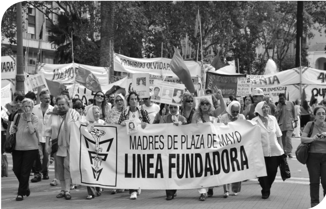
Las Madres de Plaza de Mayo - Línea Fundadora - durante su marcha semanal de los jueves en Buenos Aires, Argentina.