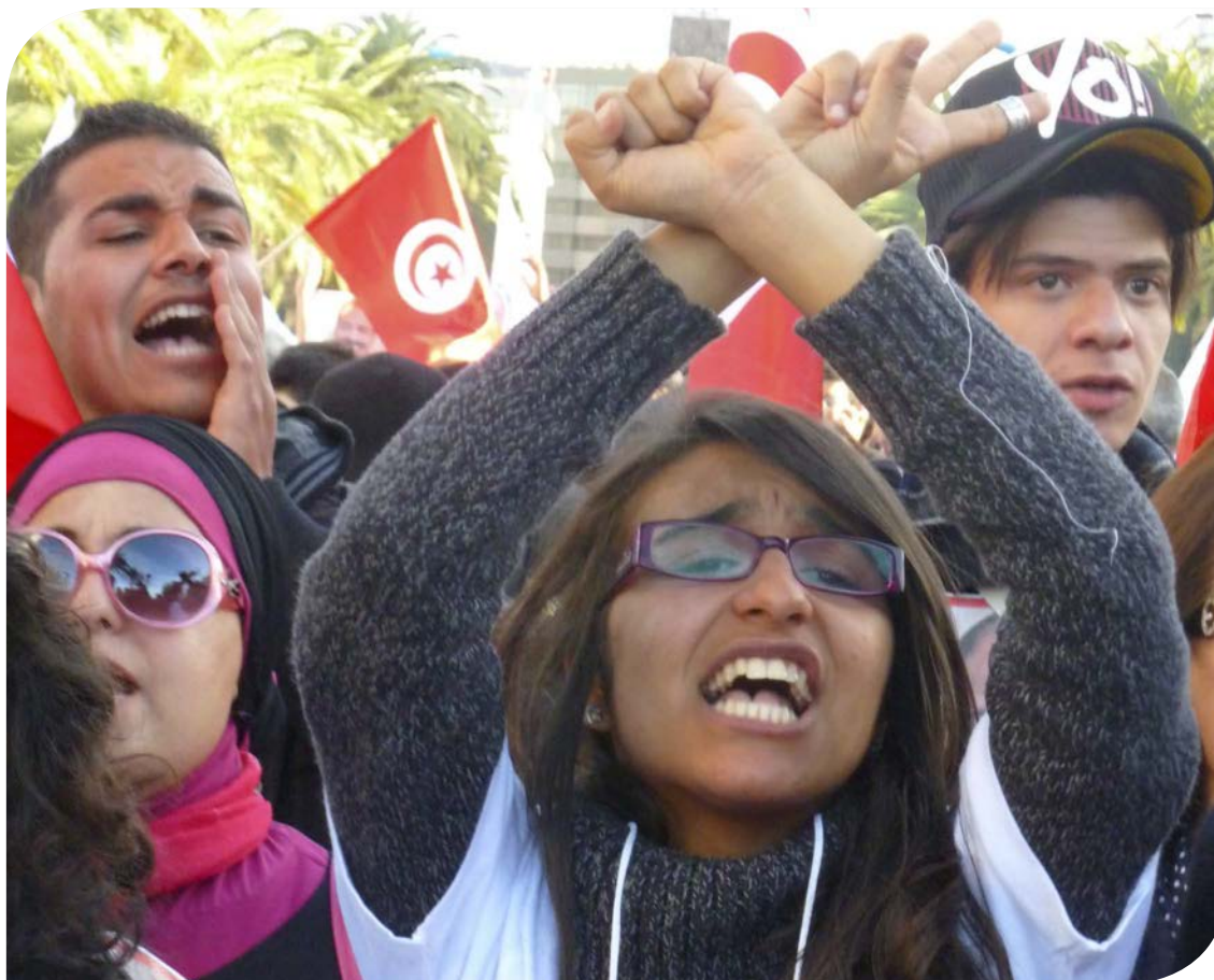
Joven mujer tunecina en la marcha inaugural del Foro Social Mundial, Túnez, marzo de 2013.