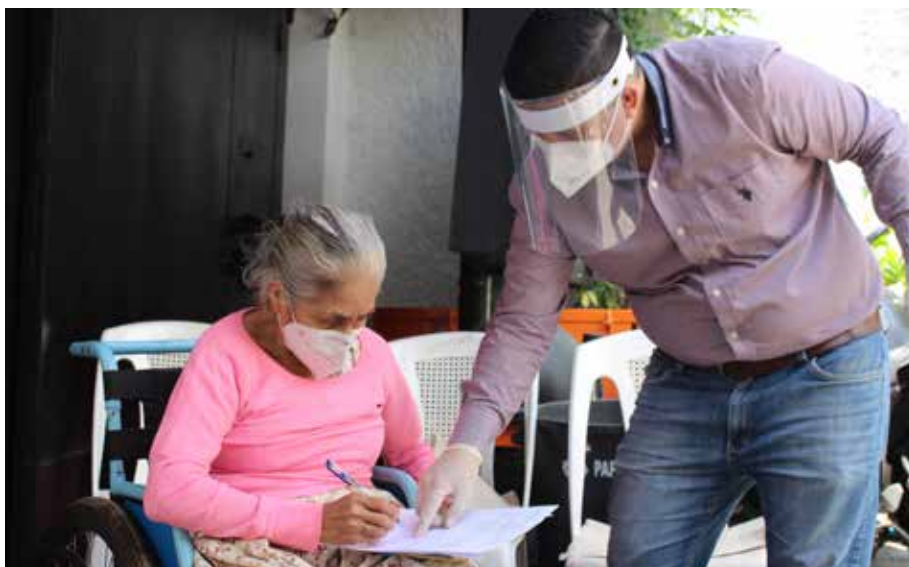
Personal de FONAT apoyando a víctimas de accidentes de tránsito.