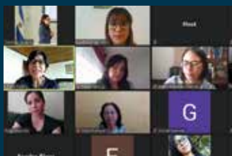
Especialistas internacionales: Acción colectiva y focalización territorial son clave para un transporte libre de violencia contra las mujeres Pág. 08