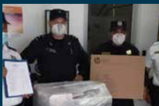
Oficinas policiales equipadas para una mejor atención a las mujeres víctimas de violencia Pág. 15