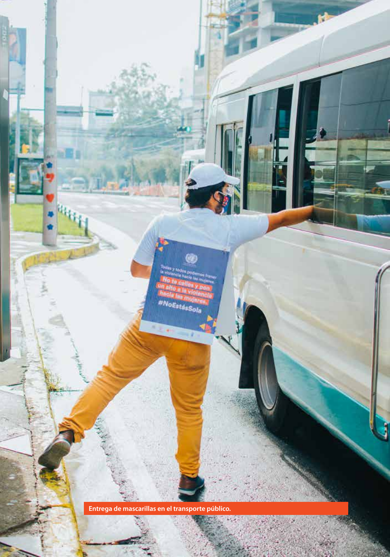
Entrega de mascarillas en el transporte público.