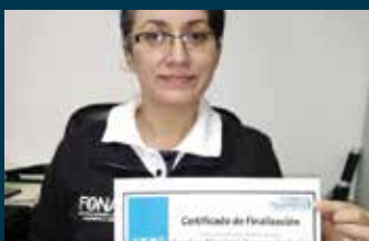
Formación con enfoque de género en el marco del Proyecto "Mujeres Libres de Violencia en el Transporte Público" Pág. 17