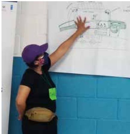
Taller de co-creación con mujeres usuarias del transporte público.