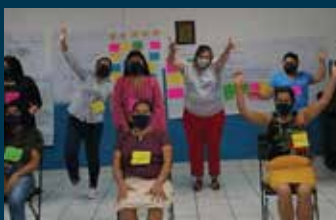
Usuarías de transporte participan en co-creación de paradas de buses Pág. 11