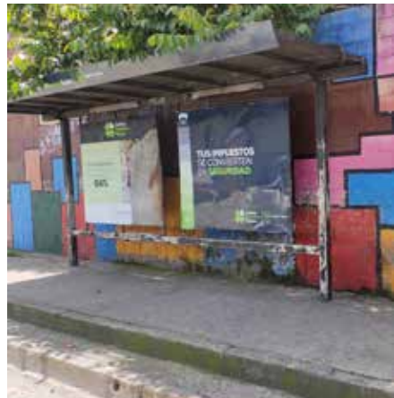
Estado actual de paradas de buses.

En términos de infraestructura destacaron la necesidad de amplitud de las paradas de buses, buena iluminación, mantenimiento permanente, buena visibilidad de lo que ocurre en ellas, adecuada rotulación e información sobre rutas y trayectos, señalización para las personas no videntes; pantallas para las personas sordas; rampas para personas con discapacidad; autobuses modernos e inclusivos, entre otras propuestas.